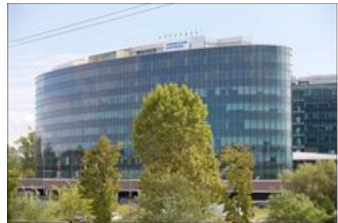
La sede di Roma

Le prime carte di credito personali (cosiddette consumer) sono state lanciate in Italia nel 1971, mentre quelle corporate, dedicate alle aziende, nel 1979.