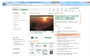
Sezione intranet dedicata