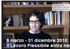
Video Clip sulla intranet