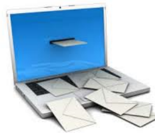
Mailing ai colleghi delle strutture che partecipano