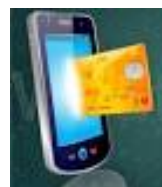
Wallet solo carte