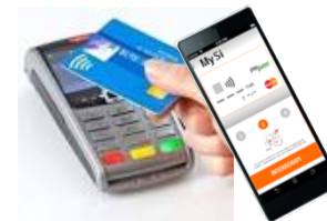
Near field communication (NFC)