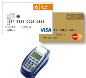
Carta e Pos