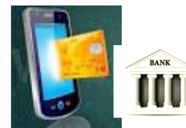
Wallet carte e conto, etc...