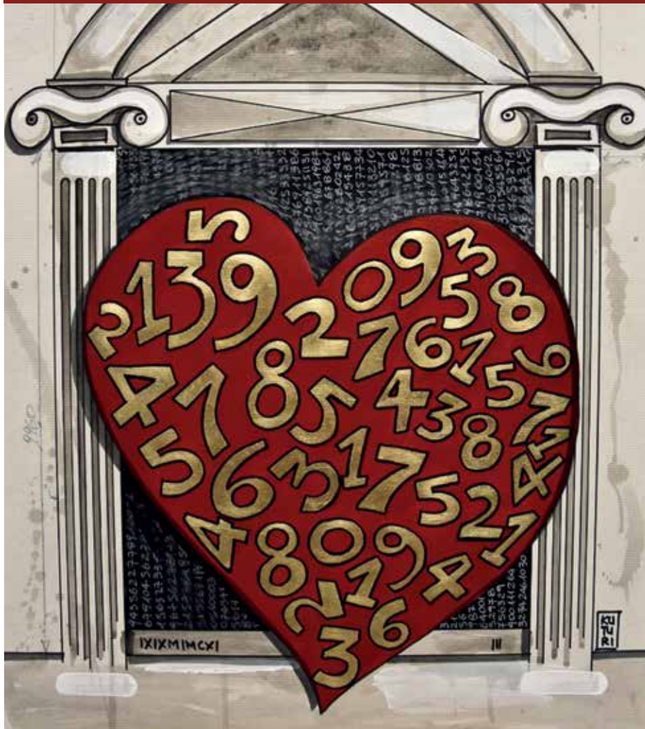
Opera: "Il valore della passione" di Kulturì